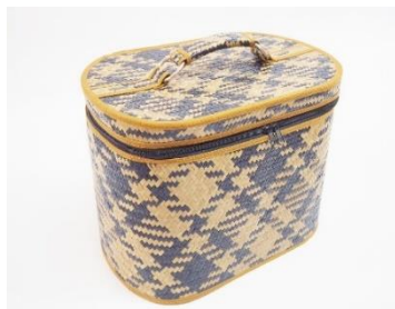
ภาพประกอบที่ 1 กล่องซิปรอบจากกระจูดรายา

ผลิตภัณฑ์กล่องซิปรอบ ของกลุ่มวิสาหกิจชุมชนกลุ่มแปรรูปผลิตภัณฑ์กระจูดบ้านพรุกาบแดงมีวัตถุดิบที่ใช้ในการผลิต ประกอบด้วย กระจูด ผ้าสปันบอล ผ้าโทเรและด้าย ซิป กาวและแล็คเกอร์ ห่วงหูกระดากซ์